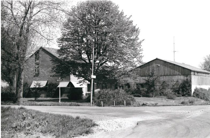
Op de foto zien we de boerderij Zuidelijke Knibbelweg 2 te Cortelande. Voor 1 januari 2026 was het adres van deze boerderij Knibbelweg 97 te Zevenhuizen.